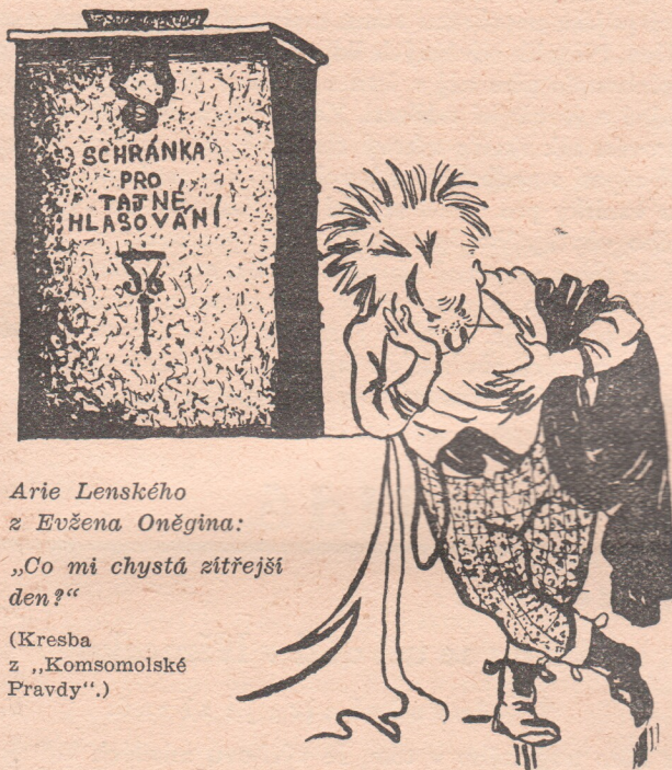
Arie Lenského z Evžena Oněgina:

Počítá se také s vlivem žen. Nejen, že asi budou tvořit značné procento voličů, ale mohou mít vliv i na své okolí. V tomto směru se dělá předvolební nálada velmi pečlivě. Komsomolu za jeho jarní revise bylo přikázáno, aby svolal zase sjezdy ženské mládeže. Podobné sjezdy, konané loni, ukázaly tak úžasný a překvapující lidský materiál a tak přispěly k poznání života země, zvláště v národnostních republikách a menšinových zapadlých krajích, že jejich opětné svolání je s hlediska volební politiky velmi moudré. Žena může toho povědět hromadu a také že poví. Starosti a potřeby vsi, škol, aulu, a jak se ještě to jmenuje v řečích národů SSSR,